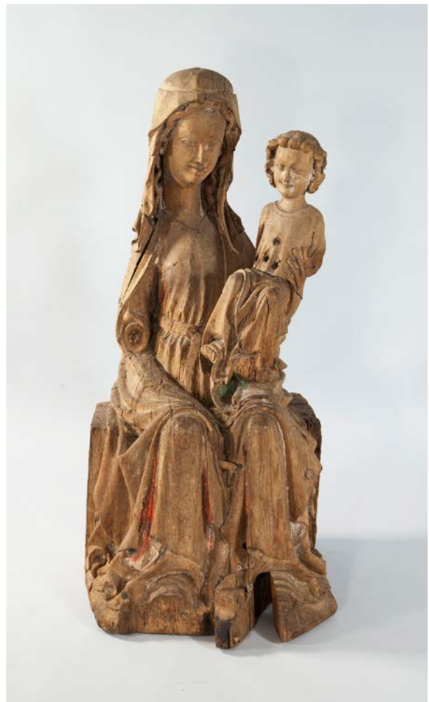
Kuva 2. Suomessa Maria oli suosittu aihe etenkin keskiaikaisessa kirkkotaiteessa. Liedon kirkossa ollut Madonna-veistos on hyvä esimerkki aiheen esitystavasta. Puuveistoksessa näkyy yhä värjäänteitä: Marian yllä on ollut punainen, sinivuorinen viitta. Itse puku on ollut kullattu. Äidin ja lapsen hiukset ovat olleet tummanruskeat. Liedon mestari, Madonna , 1300-luvun alkupuoli, tammi, 114 cm. Turun kaupungin taidekoelma. Kuva: Mikko Kynäräinen / Turun Museokeskus, kaikki oikeudet pidätetään.