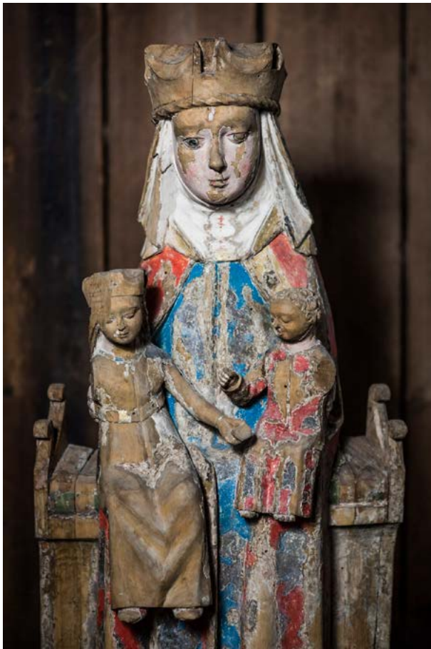
Kuva 1. Tuntematon, Pyhä Anna itse kolmantena , myöhäiskeskiaika, koivu ja tammi, 74 cm. Turun kaupungin taidekokoelma.

neudutaan Marian elämän vaiheisiin hämmästyttävän yksityiskohtaisesti. Ylimartimo pohtii esimerkiksi, mitkä saattoivat olla raskaana olleen Marian motiivit matkustaa yli sadan kilometrin päähän serkkunsa Elisabetin luo, missä hän Luukaksen evankeliumin mukaan vietti odotusajastaan kolmisen kuukautta. Ylimartimo myös esittää Sakariaan ja Elisabetin kesäkodin sijainneen Ein Karemin kaupungissa. Samoin pohditaan Jeesuksen perhesuhteita: olivatko tämän Raamatussa mainitut veljet ja siskot Joosefin edellisestä liitosta tai kenties serkkuja? Henkilöiden mielenliikkeiden ja arkielämän maalaileva spekulointi tuo Raamatun pyhinä ja etäisinä koetut hahmot inhimillisiksi ja fyysiselle tasolle. Samalla se tuo tietokirjaan kaunokirjallisia sävyjä.