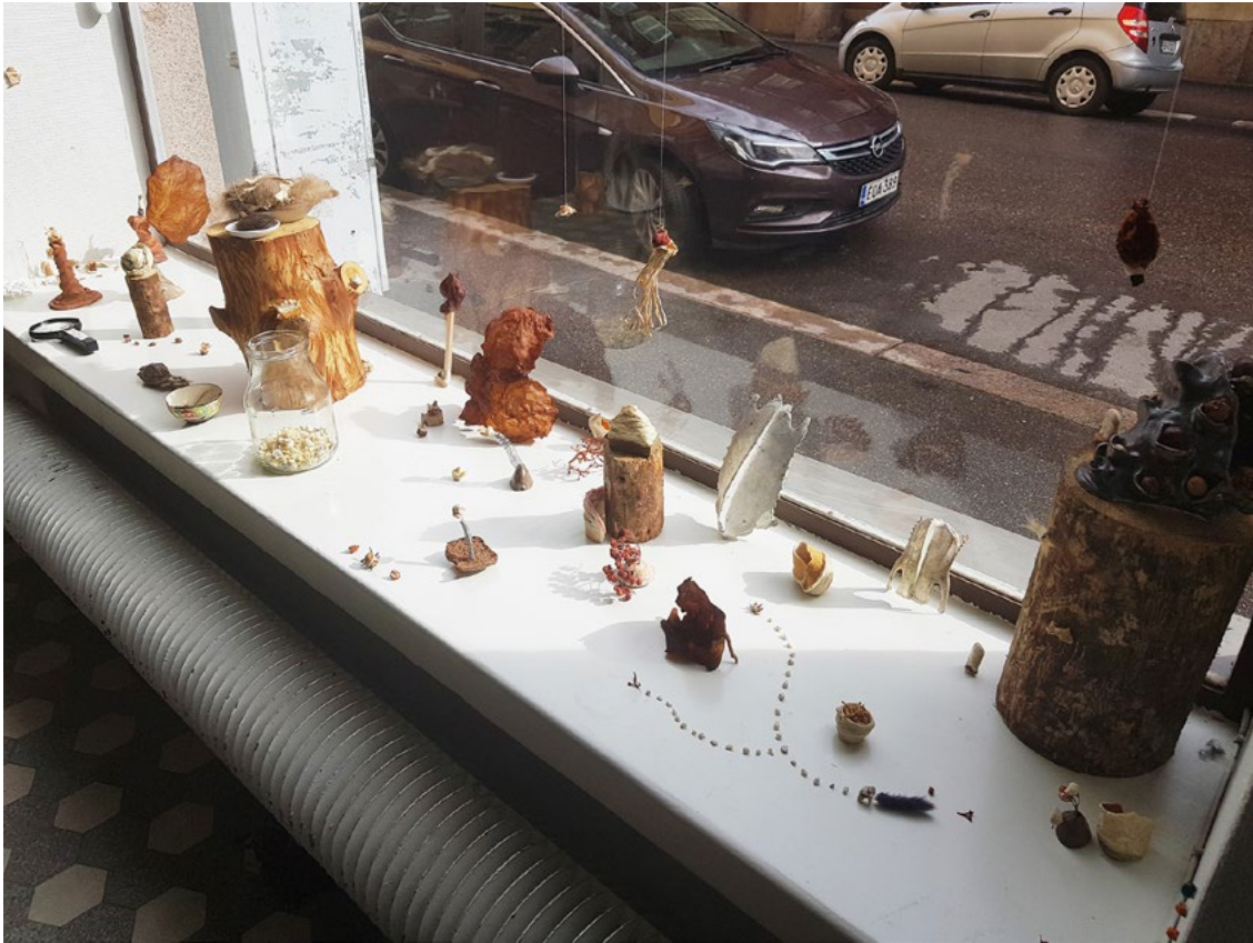
Kuva 1. Oona Leinovirtanen, Sylkiöt , 2017–(jatkuva). Sekatekniikka, koko vaihteleva. Taiteilijan omistuksessa. Kuva: Suvi Vepsä, kaikki oikeudet pidätetään.

jeksimien jätteiden keräämiseksi. 20 Kun roskaa alkoi kerääntyä taiteilijan työhuoneen tasoille, kasaantua ja tarttua toisiinsa, muotoutui niistä pikkuhiljaa pieniä veistoksia. 21 Teosmateriaalien keruu ei siten ole tapahtunut täysin tietoisesti, vaan ikään kuin ohimennen, osana arkista elämää ja siihen kuuluvaa perustoimintaa, syömistä. Syödessään ihminen vaikuttaa ja vaikuttuu yhdessä ympäröivän maailman kanssa: sekä inhimilliset ja ei-inhimilliset ruumiit tulevat syömisen kautta jatkuvasti uudeksi reagoimalla