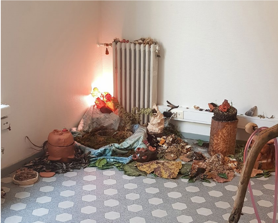
Kuva 2. Oona Leinovirtanen, Mahakompostin liepeillä , 2020. Sekatekniikka, koko vaihteleva. Taiteilijan omistuksessa.

riaaleista, joita taiteilija on pikkuhiljaa kerännyt ympärilleen. Huomioni kiinnittää installaation nurkasta kajastava punertava valo. Se hohkaa läpi ohuen, kummalliselta nahalta näyttävän materiaalin, jonka huomaan lähemmäs astuessani myös tuoksuvoimakkaasti. Materiaali on kuivunutta kombucha-viljelmää, scobyä. 33 Leinovirtanen kertoo, että scobyn mukaantulo teokseen tapahtui sattumalta, kun taiteilija joutui banaanikärpäsinvaasion vuoksi luopumaan kombucha-juoman valmistuksesta. Kärpäsentoukkia kuhiseva scoby ei enää sopinut terveysjuoman valmistukseen, mutta sen poistaminenkin tuntui väärältä. Lopulta bakteer-