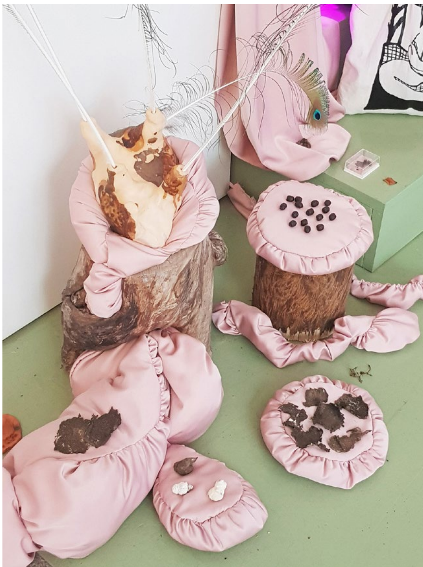
Kuva 4. Riina Hannula, We give a shit , 2020. Sekatekniikka, koko vaihteleva. Taiteilijan omistuksessa.

enää pelkää mikrobeja”. Nostan kuulokkeet korviltani ja nousen ylös.