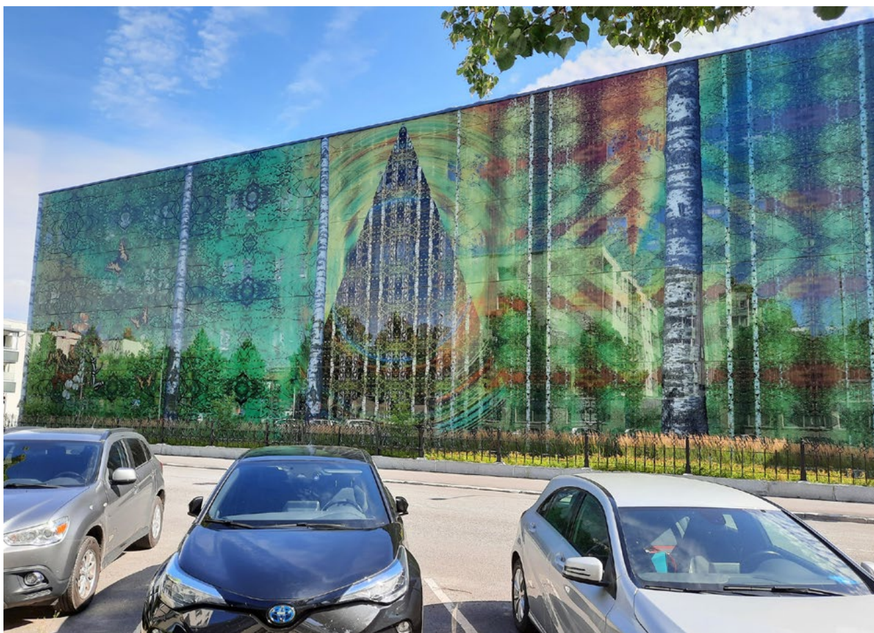
Kuva 4. Lauri Nykoppin suunnittelema, Mikkelin keskussairaalan Perhetalon julkisivuissa oleva Koivupuisto -teos (2019).

tua. Myös teosten kohdeyleisöjen ja niiden monikulttuurisuuden huomiointi vaihtelivat muun muassa teosten ripustuskorkeuden ja sairaaloiden kappeleiden tunnustuksellisuuden osalta. Taiteen julkisuus on yksi keskeinen sairaalataiteen tavoite, mutta havaintojemme perusteella julkisuus toteutuu vaihtelevasti.