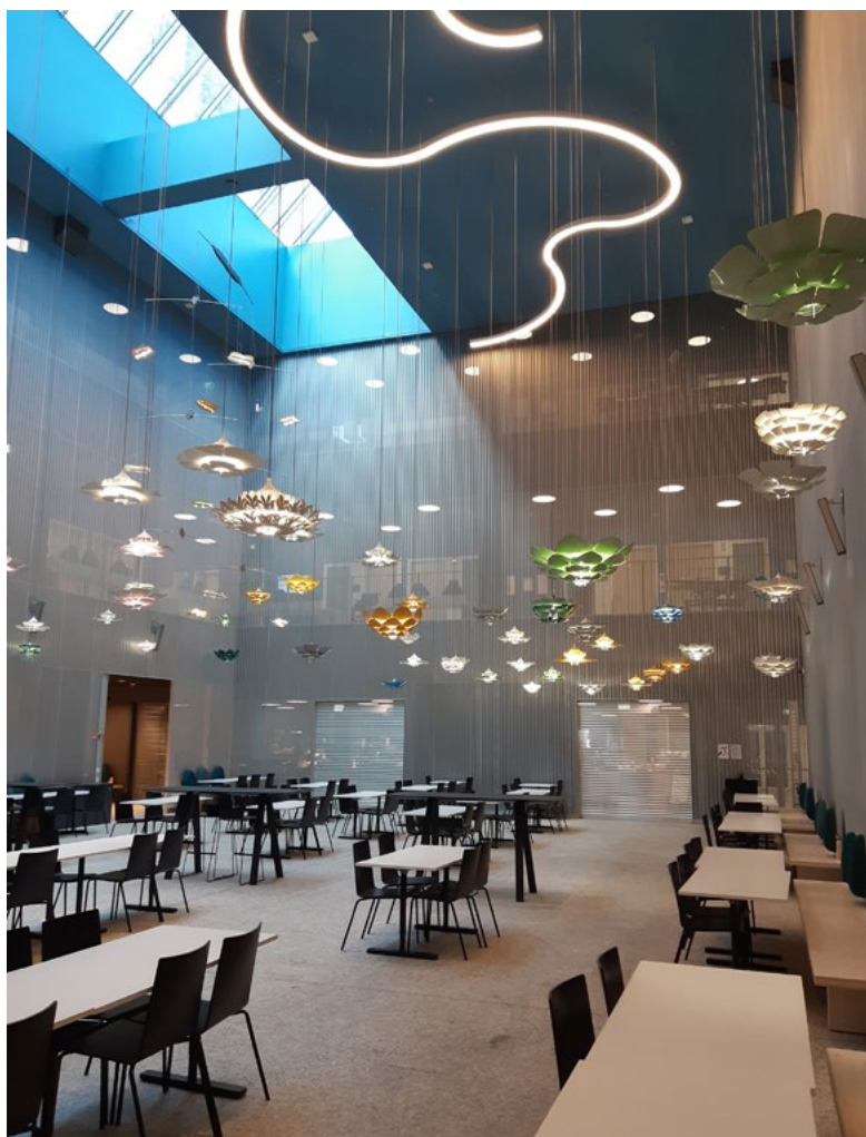
Kuva 1. Sairaala Novan ravintolaan sijoitettu Petri Vainion Kukkajärvi (2020) koostuu kymmenistä yksittäisistä valaisimista ja kahdesta mobile-valaisimesta. Sairaalan uushankintojen teemana on keskisuomalainen luonto. Kuva: Teija Luukkanen-Hirvikoski, lisenssi CC BY-SA 4.0.

periaatteella taidetta noin miljoonalla eurolla. Tutustumiskohteissamme uusi taide on usein integroitu sairaalarakennusten arkkitehtuuriin tai sisustukseen (Kuva 1). Osa arkkitehtuuriin integroidusta taiteesta, kuten pinnoitetuista sisäovista tai -seinistä, on taiteilijoiden originaaliteoksiin perustuvia digitaalisia tulosteita tai muita reproduktiokuvia. Pääkaupunkiseudun ulkopuolella toimivat sairaalat suosivat taidehankinnoissaan alueensa taiteilijoita (Kuvat 2–3). Sairaaloiden uusien teoshankintojen alueellinen painotus on merkittävä taloudellinen investointi maakuntien taiteilijoille. Sairaaloissa prosenttiperiaatetta on laajennettu myös esittävään taiteisiin ja osallistavaan taidetoimintaan.