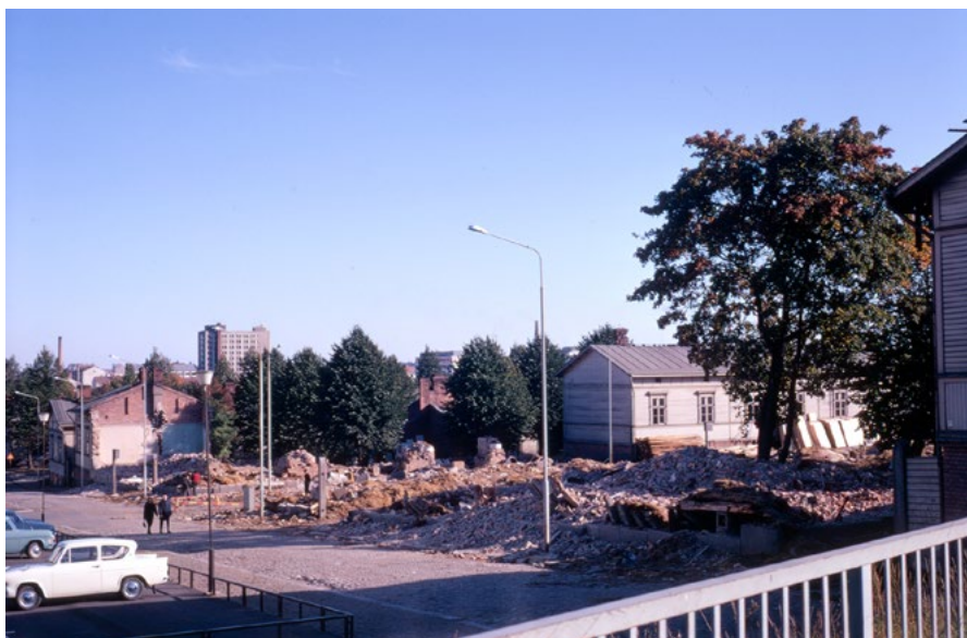
Kuva 4. Purkutyömaa Amurin länsireunalla vuonna 1968.

ja rakentamisen valmisteluun eli purkamiseen. Katutilassa oli osittain purettuja rakennuksia, rakenteilla olevia ja kokonaan tyhjiä tontteja. Amurin saneeraus kesti yli 40 vuotta – saneerausta ennakoivasta puheesta suunnittelun kautta viimeisiin rakennushankkeisiin. Prosessia voidaan kuvata pitkään jatkuneeksi välitilaksi, 72 jossa saneerattavasta kaupunkitilasta tuli huokoinen ja tulkinnoille altis. Se tarjosi paikan vaihtoehtoisille käytöille ja luoville ideoille ja sisälsi paljon potentiaalia. 73 Asukkaat saattoivat viedä tyhjeneviltä tonteilta kasveja muualle istutettavaksi, paistaa lettuja hetkeksi vielä paikoilleen jätetyillä helloilla, kierrättää puutavaraa ja tiliä. 74 Myös purkutyömaat olivat välitiloja, joissa purettavaksi aiottuja puutaloja saatiin käyttää työmaan sosiaalituloina. 75 Välitilassa oleva kaupunki olisi ollut avoin tilallisten ratkaisujen