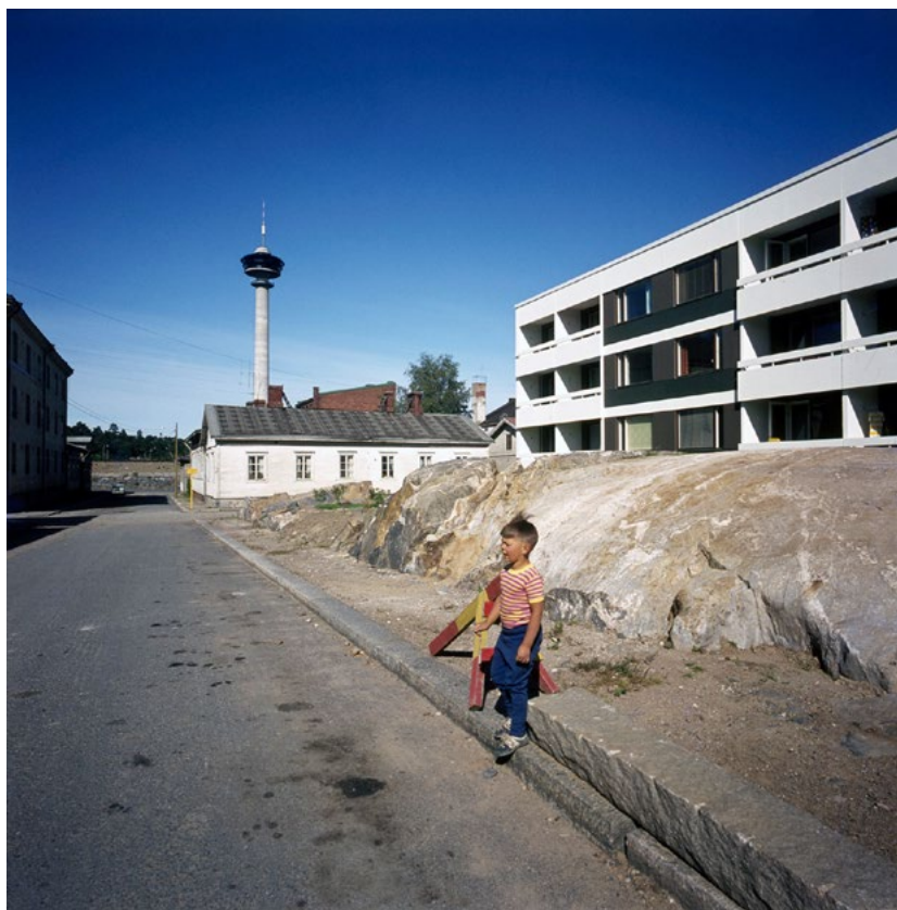
Kuva 3. Amurin saneeraus alkaa toteutua. Kuvassa Mariankatu 1970-luvun alussa, taustalla pohjoisessa Näsinneula.

Amurin uudistamiseen tähtävän asemakaavan laatiminen käynnistettiin vuonna 1951 ja kaava hyväksyttiin useiden ehdotusten nähtävillä olon jälkeen vuonna 1964. Kaavoituksen tueksi järjestettiin myös arkkitehtuurikilpailu. Kilpailulla vauhditettiin uudistusta ja toivottiin sen ”avaavan silmät näkemään saneerauksen edut ja avaaman pään muun vanhan kaupunkialueen saneeraamiselle”. 61 Tamperelaisessa kaupunkisuunnittelussa korostettiin 1960-luvun alussa palveluiden järjestämistä, pysäköintiä ja rakennustehokkuuden hallintaa. 62 Amurin asemakaava toteutti näitä tavoitteita mm. osoittamalla alueelle uudenaikaisen liikekeskuksen, lastentalon sekä keskuspuiston leikkikenttineen. Nämä toiminnot muodostivat yhdessä museoksi osoitetun puutalokorttelin kanssa uudenlaisen julkisen tilan, jossa kulttuuri- ja sosiaaliset palvelut, virkistysalueet ja kaupat muodostivat amurilaisille mahdollisuu-