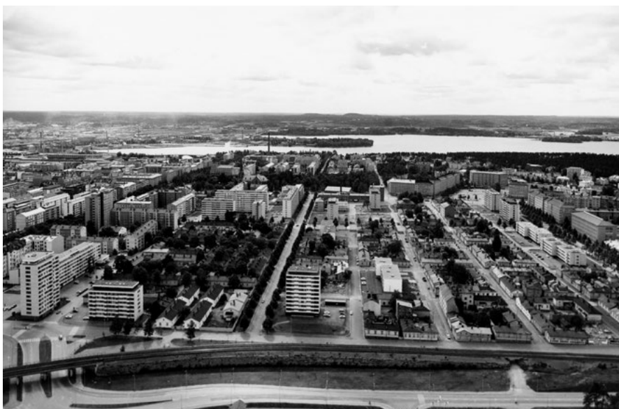
Kuva 1. Amurin kaupunginosa 1970-luvun alussa. Tämän tutkimuksen kohteena oleva alue sijoittuu kuvan alareunassa näkyvän Pohjanmaan radan ja oikeassa yläreunassa näkyvän Pyynikintorin väliin, lähelle Tampereen keskustaa.