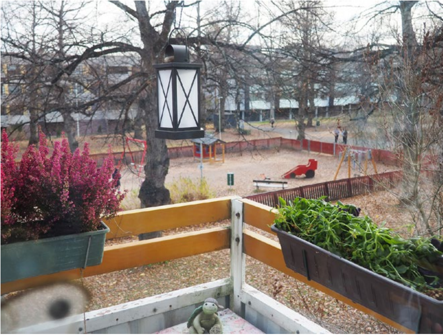
Kuva 6. Etelä-pohjoissuunnassa Amuria halkoneen Sotkankadun pohjoisosasta tehtiin puisto, jonka kylkeen sijoitettiin leikkipuisto.