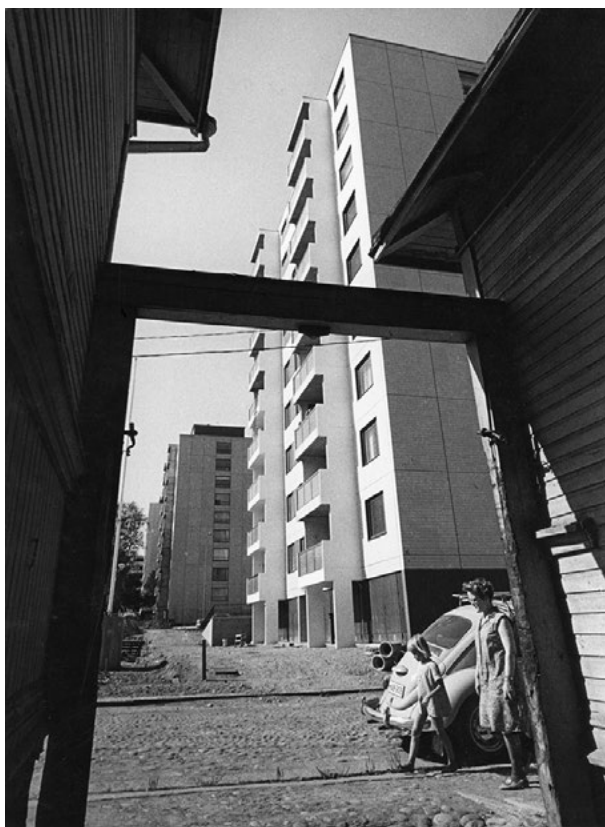
Kuva 9. Näkymä 1970-luvun alussa puutalopihaan vievältä portilta Amurin pohjoisreunalle rakennettujen tornitalojen suuntaan.

Saneeraus merkitsi jatkuvaan muutokseen ”kodiksi asettumista.” 143 Käytännössä se merkitsi tyytymistä ja tyyneyttä, jolla ympäriltä häviävään kaupunkiin suhtauduttiin. Modernisuus oli muutosvaiheessa erillisten ajankuvien päällekkäisyyksiä. Moderni ei siten ollut ”vain” modernia, vaan sisälsi myös traditionaalisia piirteitä ja ulottuvuuksia. 144 Haastatellut pitivät tärkeinä luonnonläheisyyttä, sosiaalisia suhteita, väljyyttä ja palveluiden saavutettavuutta. Tällainen arjen arvojen maailma on ikään kuin ”suomalainen versio” Jacobsin teksteissä korostuvasta aktiivisesta kaupunkielämästä, tavasta asua tilaa luonnonläheisesti, valitsemallaan yhteisöllisyyden tavalla. Kaduilla sujuvasti liikkuva auto symbo-