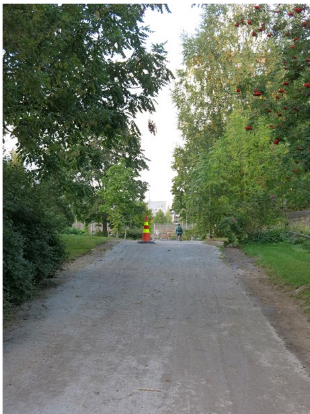
Kuva 8. Mariankatu saneerattuna.

misesta”. 135 Kivijalkakaupoista irrottautuminen olikin osa modernin projektia, siirtymistä kohti modernisuutta. Katutilaan kurottavat puutalo-kaupungin moninaiset toiminnot olivat vieraita saneerauksen tuottamalle modernismille. 136 Myös tamperelaisilla kaupunkisuunnittelijoilla oli selvä käsitys Amurin kehityksen suunnasta ja katsottiin ettei ollut ”tarkoituksenmukaista levittää kaupunkimaista asutusta keskustasta tälle alueelle”. Suunnittelussa alueesta tehtiin asumalähiön kaltainen, vain välttämättömine liikkeineen. 137 Muutosta voi pitää jonkinlaisena katutilan rauhoittamisena ja normalisointina. 138