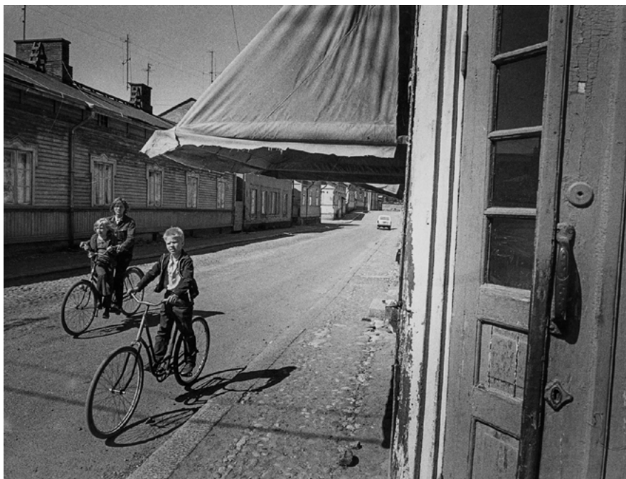
Kuva 7. Mariankatu ennen saneerausta 1970-luvun alussa.