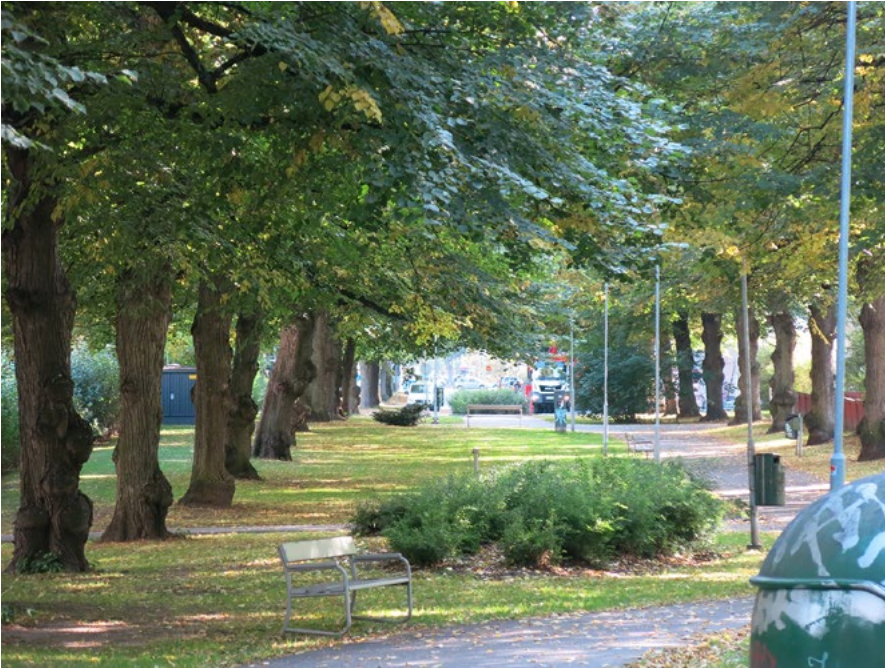
Kuva 5. Näkymä uuden amurilaiskerrostalon ikkunasta lähipuistoon. Kuva: Hannele Kuitunen 2018, kaikki oikeudet pidätetään.

Puusta rakennettuun korttelikaupunkiin liitettiin myös erilaisia aistimuistoja. Mieleen olivat jääneet esimerkiksi haju huussien tyhjennyspäivänä, hevosen hiki, kavioiden äänet kenttäkivetyillä kaduilla, laivan sireeni tai lähellä kulkevan junan kolina. Purkamiseen liittyi erään haastateltavan muistoissa kostean sahanpurun haju. 80 Saneeraus ei hävittänyt tätä katujen aistittua tilaa, vaan muutti sitä. Amurissa kuuluivat 1970-luvulla edelleen laivojen sireenit, junien, autojen ja Särkänniemen kalliolle rakennetun huvipuiston äänet. Hevosten kavioiden kopse katosi lopullisesti vasta 1970-luvun kuluessa.