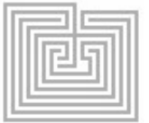
Kuva 5. Paris Photo 2016

Jättimäiseksi paisuneen ohjelman hyvä kääntöpuoli oli se, että toisaalta tapahtumas- ta varmasti löytyi jokaiselle jotakin. Yksittäi- set näyttelyt olivat hyviä ja mukaan päässei- den gallerioiden taso korkea.