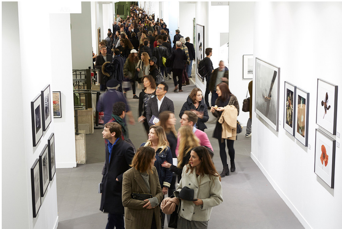
Kuva 7 (alla). Paris Photo 2016