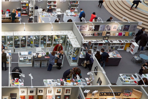
Kuva 6. Paris Photo 2016 © Jeremie Bouillon.

Hankintoja ajatellen Paris Photo on tärkeä kohde paitsi yksityisille taiteenkerääjille, myös esimerkiksi museoille. Museoita oli myös näytteilleasettajien joukossa. Centre Pompidoun valokuvakokoelman hankintoja kymmenen viime vuoden ajalta esiteltiin erillisessä näyttelyssä Pencil of Culture , joka nimellään viittasi valokuvan historian klassikkoteokseen, Henry Fox Talbotin Pencil of Natureen vuodelta 1844. Tällä viittauksella haluttiin tuoda esille valokuvan kehitystä meitä ympäröivän fyysisen todellisuuden tallentajasta kulttuuristen ilmiöiden sekä sosiaalis-