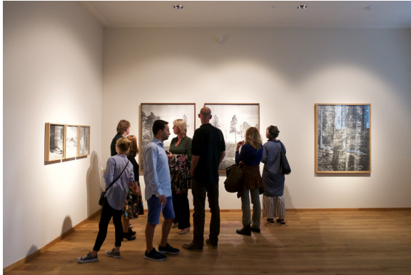
Kuva 4. Museum Het Schip 'Touched' © Ernst van Deursen.

viettäneet mieltävät valokuvauksen ytimeksi, mutta joka nuoremmalle sukupolvelle saat- taakin olla ”uutta”.