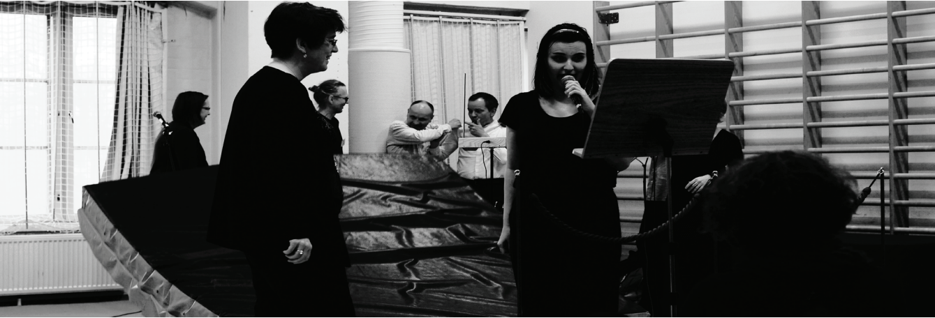
Kuva 7. Työpaja What is Given 29.4.2017 Teatterikorkeakoululla. Filosofien joukkue etualalla.

tunnistivat 'filosofiksi', 'esiintyjäksi' tai 'katsojaksi'. Erotuomarina kloonasin erotuomaria ja taiteilijuutta epäselvästi artikuloituna. Kloonasimme enemmän tai vähemmän epäselvästi asentoja, jotka eivät kantaneet – emme siis havainneet väittelyä ruumiiden ja filosofisen argumentaation välillä, emmekä olleet todistamassa Monty Pythonin kaltaista ”Filosofien jalkapallo-ottelua”. Esitykseltä odotamme, että se tuottaa jotain määrittyä tietoa, mutta sen sijaan esitys näyttääkin ajattelevan siten, että se on joko riittämätöntä tai väärällä tavalla artikuloitua suhteessa esityksen filosofiaan. Esityksen ajattelu ei muistuta esityksen ajattelemista. Niiden jättämät jäljet eroavat toisistaan. Ne kerrostuvat, mutta eivät sekoitu.