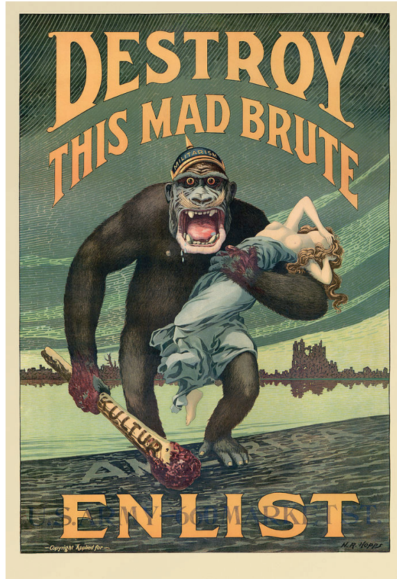
Kuva 6. Harry Ryle Hopps, Destroy this Mad Brute , c. 1917. Litografia, 106 x 71 cm.

Yhdistelmällä symbolista ambivalenssia ja tieteellistä kiistanalaisuutta oli myös kääntöpuolensa, joka paljastui nopeasti etenkin vuoden 1859 version kohdalla. Nykykatsojalle Gorille enlevant une négresse näyttäytyy kuvakieleltään melko säyseänä, etenkin verrattuna vuoden 1887 versioon, mutta siten kohtaat luentatavat eivät selvästikään olleet. Jos, kuten olen ehdottanut, Frémiet'n tarkoituksena oli tuottaa teos, jota ei luettu symbolisen tai allegorisen ulottuvuuden kautta, vaan ennemminkin 1800-luvun objektiivisten vaatimusten mukaan, hän