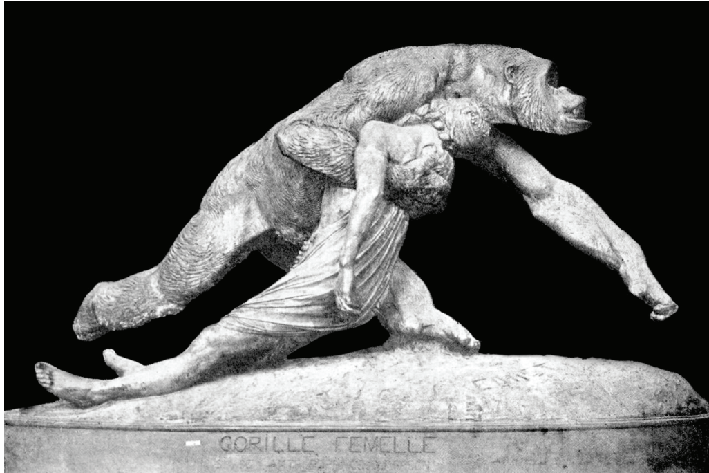
Kuva 2. Emmanuel Frémiet, Gorille enlevant une négresse , 1859. Kipsi, luonnollista kokoa suurempi. Tuhoutunut vuonna 1861. Lähde: https://upload.wikimedia.org/wikipedia/commons/8/86/Gorille_enlevant_une_négresse.jpg . Gorille enlevant_une_négresse.jpg

huomioida, että Goncourt'ien puhuessa 1850-luvun Ranskasta käsin eivät he varmastikaan viittaa englantilaisen tai saksalaisen romanttisen maisemamaalauksen voittokulkuun, joka nykyisen historiankirjoituksen valossa saattaisi ensimmäisenä