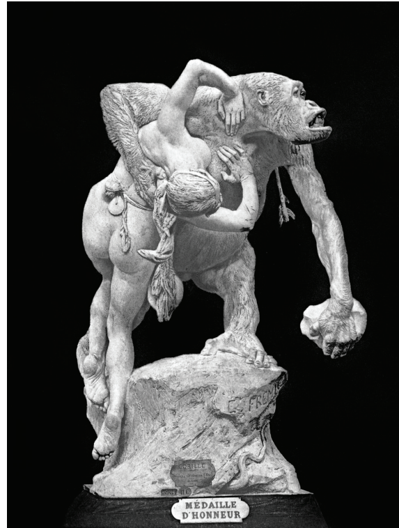
Kuva 3. Emmanuel Frémiet, Gorille , 1887. Kipsi, 187 x 167 x 100 cm. Musée des beaux-arts, Nantes.

Kuten niin usein, myöskään Frémiet’n kohdalla skandaali ei hälvettyään vaikuttanut epäsuotuisasti hänen uraansa. 1860–1880-luvuilla hän sai useita tärkeitä julkisia tilauksia, joista ehkä merkittävimpiä ovat Louis d’Orléansin (Château de Pierrefonds; 1869), Jeanne d’Arcin (Place des Pyramides; 1874) ja Napoleon I:n (Isère, Route Napoléon; 1868) ratsastajapatsaat. Frémiet nimitet-