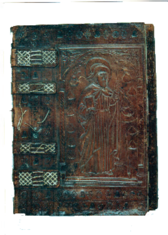
Kuva 4. Rechnungsbuch der Wetteherren 1521-1570.

koristelussa. 1500-luvun alkupuolella olivat suunnannäyttäjinä tunnetut embleemien kokoomateokset ja vuosisadan lopussa, vuonna 1593 ensimmäisen kerran ilmestynyt Cesare Ripan teos Iconologia . Yhä tänään hyödyllinen teos on ollut yhtenä tukikohtana ja apuvälineenä koristelukuvien selityksessä myös tässä tutkimuksessa.