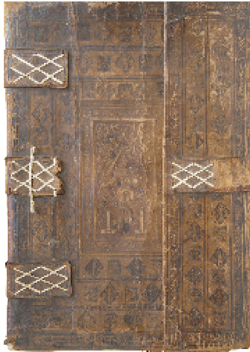
Kuva 5. Niedergerichtsprotokolle in Kriminalsachen aus den Jahren 1605-1655. TLA, Best. 230, Verz. 1, Nr. Aa 44b.

Tallinnan kaupunginarkiston sidoskokoelmaa tarkastellessa voi sanoa, että se on moni-ilmeinen ja heterogeeninen kokonaisuus. Tämä puhuu sen puolesta, että siellä on monen mestarin tekemiä kirjansidoksia. Tallinnassa toimineista mestareista tiedetään, että 1500-luvun alkupuoliskon kirjansitojat kuuluivat pääosin papistoon, jonka päätehtävä oli palvella seurakuntaa ja jotka sitten tekivät tavallaan sivutyönään kirjansidoksia. Myöhemmin sitojat olivat pääasiassa kirjakauppiaita ja/tai ammattimaisia kirjansitojia.