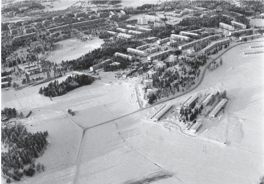
Kuva 3. Keski-Vuosaaren metsäkaupungissa rakentaminen sijoitettiin huolellisesti maisemaan.