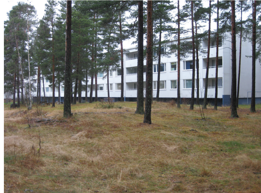
Kuva 4. As Oy Kivisaarentien metsäpiha Keski-Vuosaassa. Luonnontilainen mäntymetsä soljuu rakennusten lomaan.