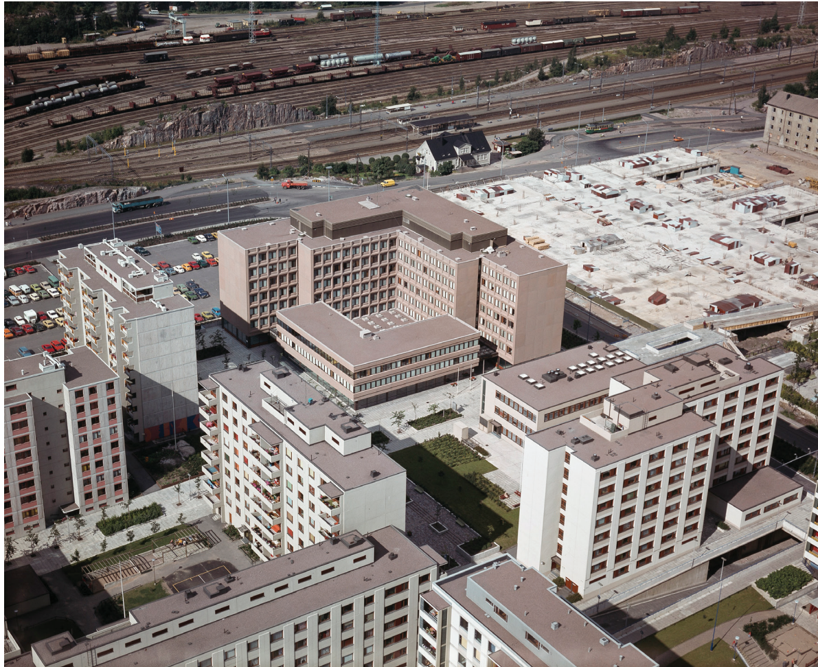
Kuva 5. Itä-Pasilan rakennettua kaupunkivihreää vuonna 1977. Ruutukaava, tiivis korttelirakenne ja pienet puistikot edistivät sosiaalisia kohtaamisia.

jossa maisemasuunnittelu nousi näkyvään rooliin arkkitehtuurin rinnalle. Tapiola avasi oven suomalaiselle modernille maisema-arkkitehtuurille, ja sen perintö välittyi sodanjälkeisiin metsäkaupunkeihin. Vaikka metsäkaupungeissa maisema-arkkitehtien kädenjälki oli visuaalisesti huomaamattomampaa kuin Tapiolassa, heidän työnsä edisti kuitenkin luonnontekijöiden ja puuston huomioonottamista ja viihtyisämpien asuinympäristöjen toteutumista. Kun rakentamisen volyymi kasvoi, maisema-arkkitehtien tehtäväkenttä laajeni ja myös vaikeutui vaativien rakennushankkeiden myötä. Tiivis kompaktikaupunki teknisine kansirakenteineen ja istutusaltaineen oli vihreän asuinympäristön toteuttamisen kannalta metsäkaupunkia huomattavasti haastavampi. 1970-luvulla yleistyneet asuinympäristön ja pihojen suunnittelua koskevat ohjeet ja normit pyrkivät ohjaamaan laajentuvaa suunnittelun kenttää ja edistivät samalla maisemasuunnittelun vakiintumista osaksi kaupunkisuunnittelua. Kehitystä tuki myös voimistunut ympäristöliike ja ympäristöongelmien tunnistaminen, mikä loi pohjaa ekologiselle suunnittelulle. 77