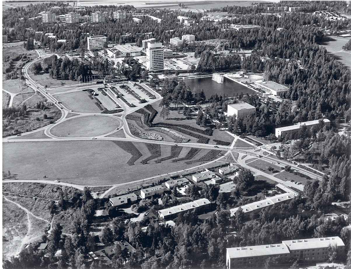
Kuva 1. Tapiolan puutarhakaupunki ja Leimuniityn maisemakonstrasteja.

reät kasvit laattapihan istutusalueissa peh-mensivät ja ikään kuin vaatettivat talojen yksinkertaisen, pelkistetyn arkkitehtuurin linjoja. 34