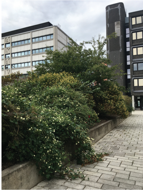
Kuva 6. Itä-Pasilan kansipihojen vehreyttä. Kompaktikaupungin pihat ja puistot loivat pehmeyttä massiiviselle betonirakentamiselle.

musta mutta myös uudelleenarviointia. Vaikka 1950–70-luvulla etsittiin hahmoa nimenomaan suomalaiselle ilmaisulle maisema-arkkitehtuurissa, kehitykseen heijastui myös kansainvälinen keskustelu. Nämä kansainväliset kytkökset ja modernin suomalaisen maisema-arkkitehtuurin vaikutteet ovat kuitenkin pitkälti kartoittamatta. Myös arkkitehtuurin ja maisema-arkkitehtuurin suhteen tarkempi analyysi vaatii lisätutkimusta. Esimerkkikohteet osoittavat, että vaikka maisema-arkkitehtuuri seurasikin asemakaavoituksen asettamaa kehystä, sillä oli kuitenkin merkittävä ja itsenäinen rooli ympäristön muotoutumisessa. Maisema-arkkitehtuuri vastasi kaupunkivihreän muodonannosta, sisällöstä ja toiminnoista. Maisema-arkkitehtuurin ja arkkitehtuurin vuoropuhelu ansaitisi kuitenkin enemmän huomiota tutkimuksessa.